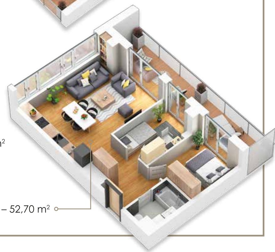
○ 3 pokoje – 52,70 m 2