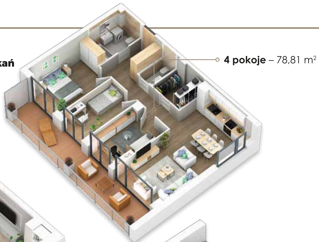
○ 4 pokoje – 78,81 m 2