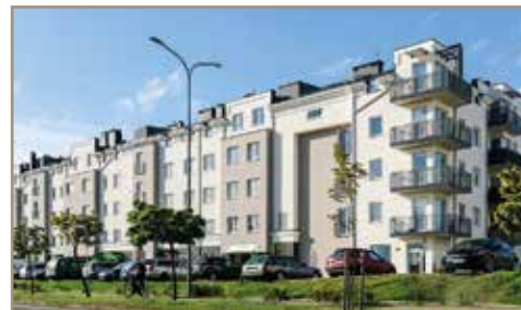
Osiedle Królewskie - Rumia