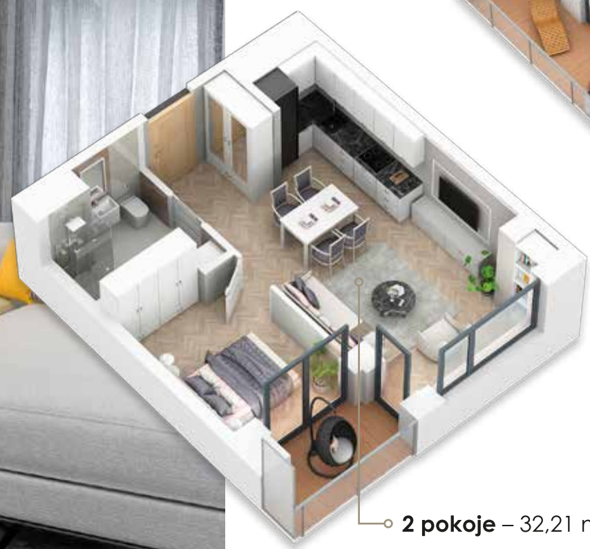
○ 2 pokoje – 32,21 m 2