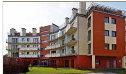
Apartamenty Foka - Hel