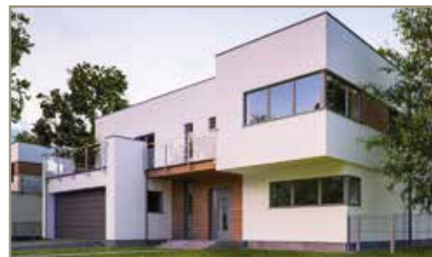
Osiedle Leśne - Łódź