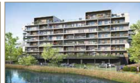
Osiedle Twoja Dolina - Katowice