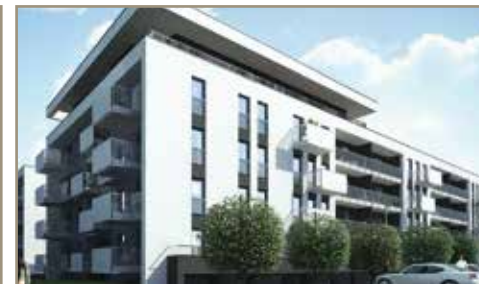
Osiedle Diamentowe - Konin