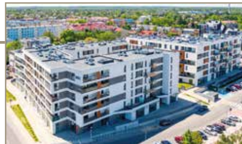
Apartamenty Reymonta - Skierniewice