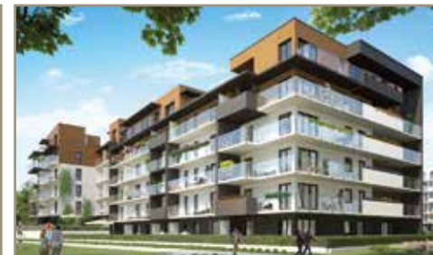
Helenów Park - Łódź