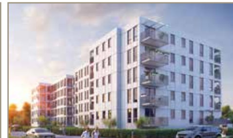
Nowa Strefa - Żyrardów